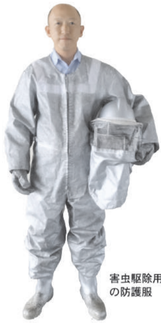
害虫駆除用の防護服