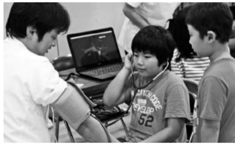
医師・看護師ブース:聴診器を使って心臓と肺の音を聞く体験