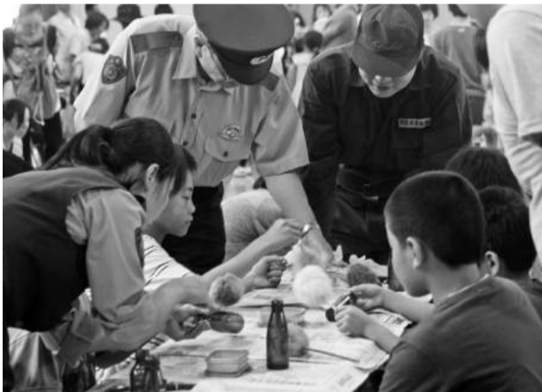
警察官ブース:ピンについた指紋を調べる鑑識体験