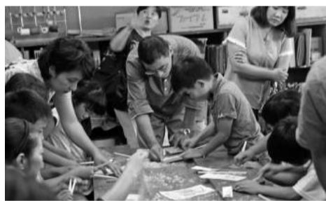
森林整備士:間伐材の有効利用を学習してからの箸づくり体験