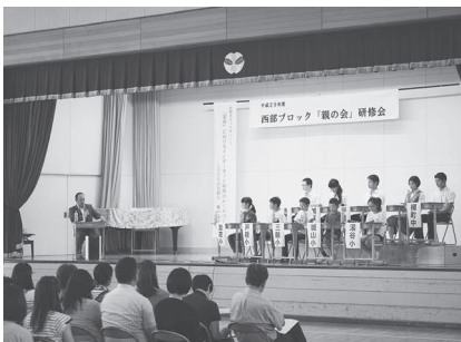
前半は各校代表のパネルディスカッション

総務省のまとめによると平成28年には、国内でインターネットを利用できる人が1億人を超えました。そしてその9割以上が携帯端末であり、うち8割が常時ネットとの接続が可能な状態だということ。利用目的を見ると、メールやSNSといった友人知人とのコミュニケーションが圧倒的に1位。情報の検索や商品の購入、動画の閲覧、オンラインゲームと続きます。小