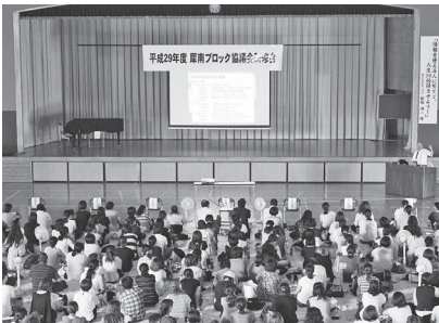
全参加者同士が例題体験する場面も

皆さんは自分をきちんと自己紹介できるでしょうか? 昨日の1日を説明できるでしょうか? 身の周りの事実を端的に伝達したり、上手に想いを表現したりするというのは技術であり、訓練で向上が可能です。家族や友人と、学校や会社の面接、仕事などで、将来にわたって活躍する場面の多い貴重な講話でした。