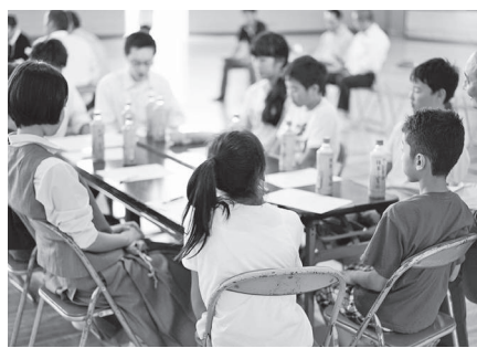
皆で意見を出し合い、まとめて発表へ

さまざまな意見交流を通して、自ら考えて気づき深めることを目的とし「長野市キッズサミット」を開催しました。ネット利用時間に関する課題、注意すべき危険性について話し合う内容や発表は的確かつ具体的に、会場の大人たちが逆に驚き、感心する場面も。 とかく講演会形式が多く、そのテーマや講師の選択に重点がいてしまいがちな昨今の活動。今回の取り組みは、子どもたちの主体性を活用しつつ、参加した大人全員を能動的にするという意味でも、今後のあり方のヒントに溢れるものでした。