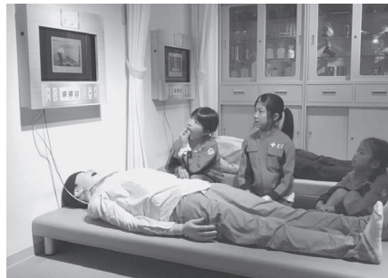
真剣な表情でモニターを見つめる子たち

全国的にも珍しい取り組みであり、今年のテーマである連携をもとに地域企業の支援を受け、子どもたちに「働く意味」や「職業観」を養ってもらいたいと、千葉県千葉市にある職業体験施設「カンドゥー」へのツアーを催しました。 パイロットを始め、建築士、新聞記者、技術者やカフェ店員など、30種類以上の職業を体験できるこの施設は、親子3世代