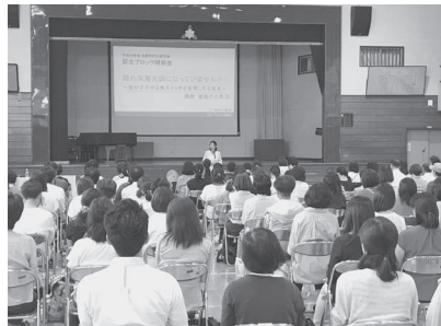
工夫のひとつで子どもが変わる

成長する子どもたちにとって、食事がどれほど重要なものか。適量摂取もそうですが、頭と身体のためには、何を食べるのかも大事な。嫌いなものを食べるようになる工夫、そしてそれはやる気アップや、根気、集中力、持久力、苦手克服の強いココロ作りにもなる秘訣を聞きました。※4面特集記事も合わせてどうぞ。