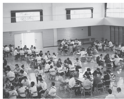
後半はテーブルディスカッション

さまざまな意見交流を通して、自ら考えて気づき深めることを目的とし「長野市キッズサミット」を開催しました。ネット利用時間に関する課題、注意すべき危険性について話し合う内容や発表は的確かつ具体的に、会場の大人たちが逆に驚き、感心する場面も。 とかく講演会形式が多く、そのテーマや講師の選択に重点がいてしまいがちな昨今の活動。今回の取り組みは、子どもたちの主体性を活用しつつ、参加した大人全員を能動的にするという意味でも、今後のあり方のヒントに溢れるものでした。