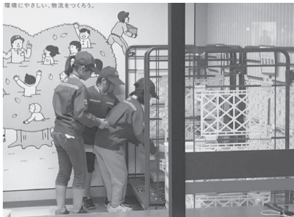
段取りや用語など覚えることはたくさん

全国的にも珍しい取り組みであり、今年のテーマである連携をもとに地域企業の支援を受け、子どもたちに「働く意味」や「職業観」を養ってもらいたいと、千葉県千葉市にある職業体験施設「カンドゥー」へのツアーを催しました。 パイロットを始め、建築士、新聞記者、技術者やカフェ店員など、30種類以上の職業を体験できるこの施設は、親子3世代