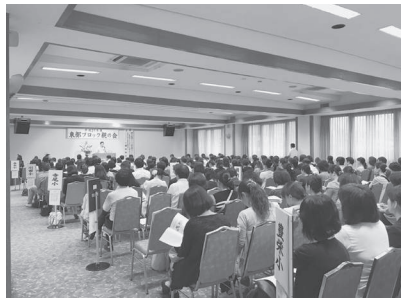
大人全体が社会のなかでの当事者

何らかの発達障害や学習障害を持つ子どもは全体の16%いるという専門家もいるようで、それは実に6人に1人という比率。そのレベルも益々多様になる時代にあつて、もはや当事者家庭だけの問題でなく、地域の親や社会全体がどう考え、何をすることが望ましいかとの視点でも、さまざまな気づきがありました。