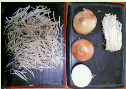
エノキダケ100gの栄養素を別の食材に例えると玉ねぎは300g(約2個半)もやして300gになります。

お子さんは好き嫌いなく食事をしていきますか。「好き嫌いなく食べてすやかに成長してほしい」と願う親の心とは反対に、子どもの野菜がらいで困っている方も多いのではないのでしょうか。そこで、今回は「子どもの苦手な野菜」を調べてみました。