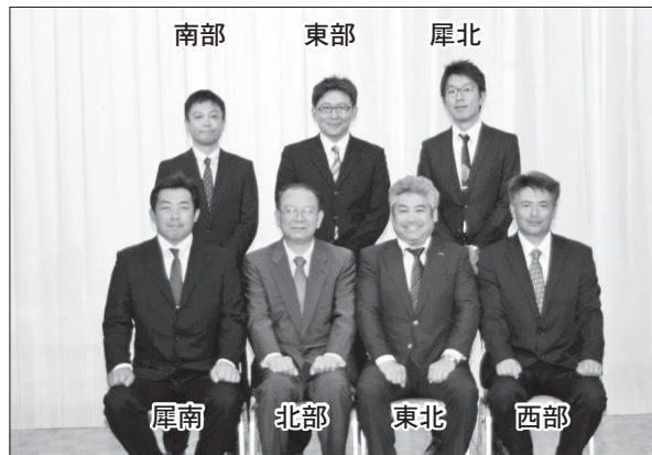
平成29年度ブロック長の皆さん

長野市PTA連合会は、78の小中学校のPTAが7つのブロックにわかれて活動しています。各ブロックでは、年に2回の事業を開催し、学校、家庭、地域が連携し会員同士が支え合い、学び合いながら育ち合う親のサポートに取り組んでいます。(各校数字は児童数)