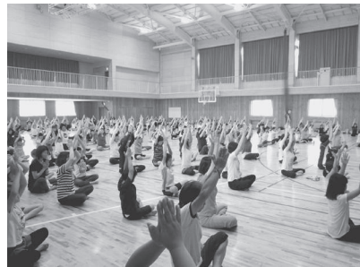
親子で気軽に優しくできるヨガ

ヨガには体の柔軟性向上、集中力アップ、またはヒーリング的な要素はもちろん、ゆつくりと自身の体と向き合い労ってやることで、自らを愛する心や自信を持てるそう。頭と心のモヤモヤを晴らし、心地よい汗を流すことを、親子で一緒に共有する時間そのものが、とても尊ぶべき機会だと肌で感じました。