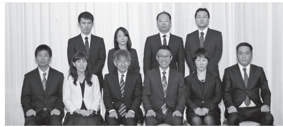
平成29年度正副・委員長