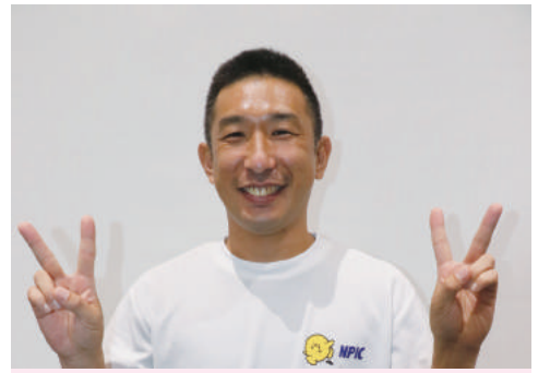
NPIC (長野体育指導センター)

コロナ禍でのおうち時間はいかがお過ごしでしょうか。運動不足や毎日の食事を気にされている方もいらっしゃると思います。ここではお部屋でできるエクササイズと自宅で楽しく作れるピザのレシピをご紹介します。家族みんなで健康な体を作りましょう。