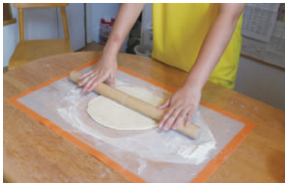
生地を薄く丸く伸ばします。