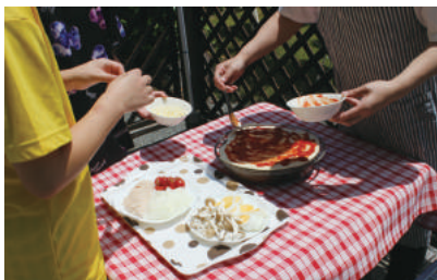
ピザソースを塗り、具材を乗せましょう。切り分けた時、ケンカにならないよう具材は均等に!