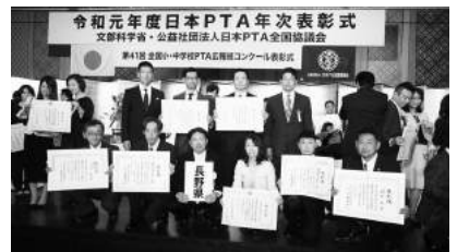
令和元年度日本PTA年次表彰式 文部科学省・公益社団法人日本PTA全国協議会

公益社団法人日本PTA全国協議会は、会員数約800万人、約2万6千校の学校ごとのPTAが所属する日本最大の社会教育関係団体です。その中で、長野県は、全国64地方協議会を9つのブロックに分けた内の関東ブロックに所属しております。平成25年度に、税制上の優遇によって効果的に会費を使用させていたこと、また団体としての信用性を高めること等を目的に、政府の厳しい審査を受けて公益社団法人格を取得しました。