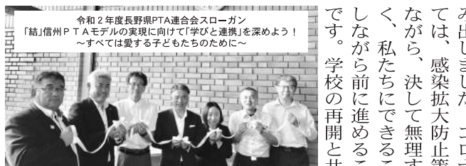
令和2年度長野県PTA連合会スローガン 「結」信州PTAモデルの実現に向けて「学びと連携」を深めよう！ ～すべては愛する子どもたちのために～

71年目を迎えた長野県PTA連合会は、進化するPTA組織を目指し、「大人の学びの機会の提供」と「関係諸団体との更なる連携」をはかり信州PTAモデルの実現に向けて一歩を踏み出しました。コロナ禍においては、感染拡大防止策をはかりながら、決して無理することなく、私たちにできることを模索しながら前に進めることが重要です。学校の再開と共に私たち県PTAもスタートルシました。児童・生徒総会・生徒総会をオンラインで工夫しながら開催している様子を目にし