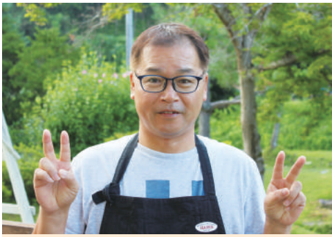
広報委員会 副委員長