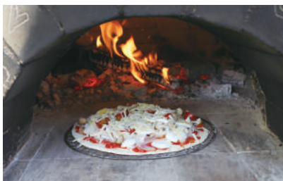
全体にピザ用チーズを乗せて焼きます。今回は石窯ですが、オーブンでも充分です。(230度予熱) チーズが美味しそうにとけたら完成!!